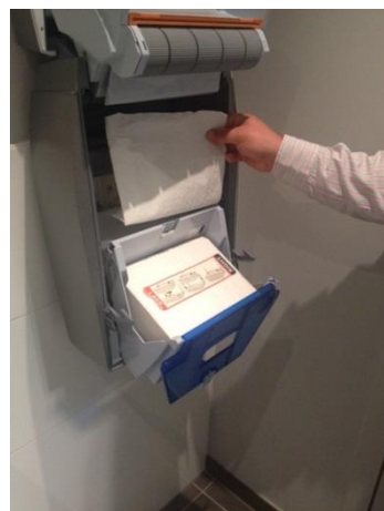
10. Placez toute la cassette dans le support et tirez le papier que vous avez insérez vers le haut.