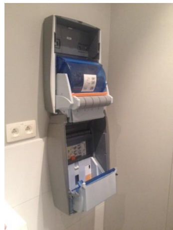
3. Faites basculer le couvercle doucement, sans cogner le mur.