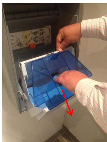
6. Ouvrez le couvercle bleu du porte-cassettes en bas.