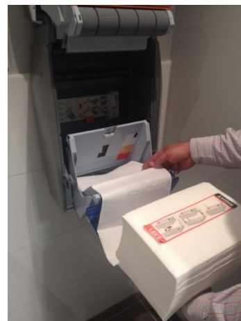
8. Prenez la cassettes avec l'image de la bande vers le haut, tenant compte de la bonne direction (Left = côté gauche, Right = côté droit)