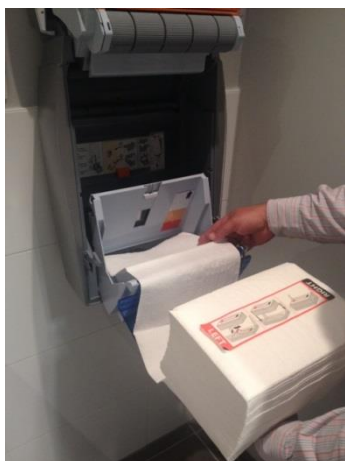
9. Faites glisser le papier du dessous de la cassette par l'ouverture sous le porte- cassettes.