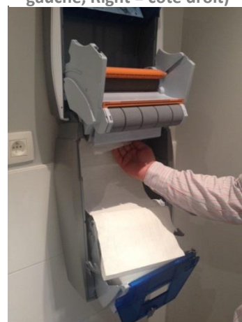
11. Faites passer la serviette par l'ouverture, derrière le porte- rouleau