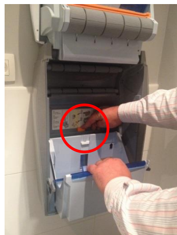
7. Appuyez sur le bouton orange du porte-cassettes qui va se basculer ensuite vers l'avant.