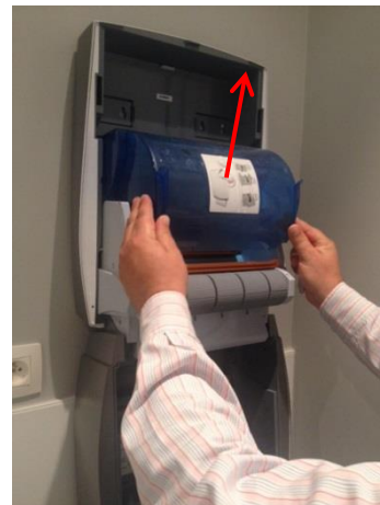
4. Ouvrez le couvercle hygiénique du haut.