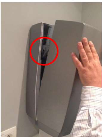
20. Sluit de kap mooi recht zodat de sluihaken niet scheef trekken