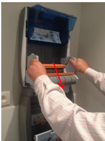
5. Kantel de rolhouder naar voren.