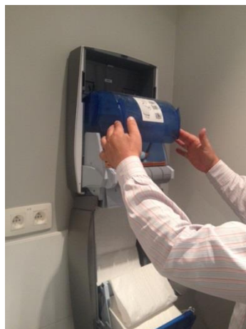
17. Sluit de bovenste hygiëneklep.