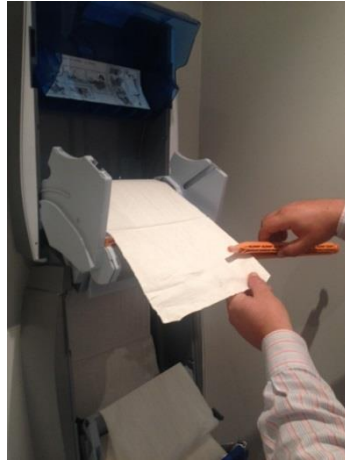
13. Schuif het begin van de handdoekcassette in de oprolas