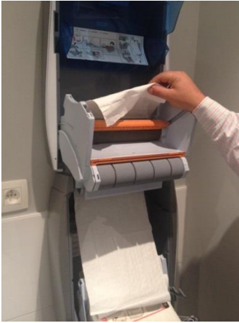
12. en door de opening naar boven.