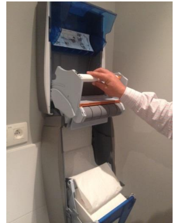
15. Leg de oprolas terug in de houder.