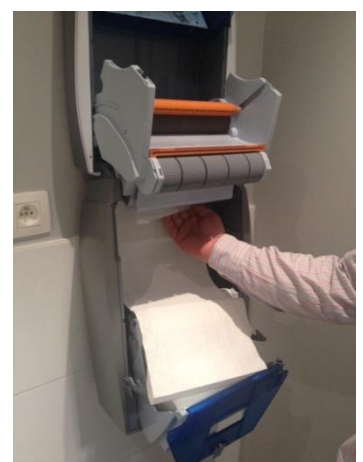
11. Voer deze achter de rolhouder