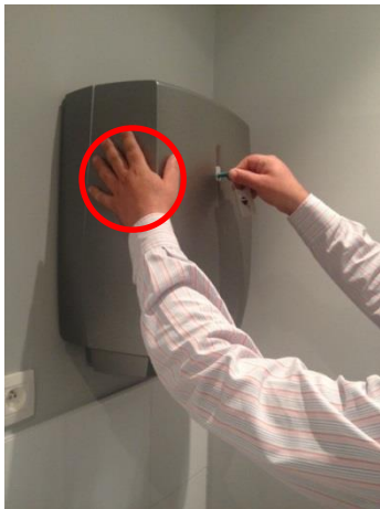
1. Open de automaat met de sleutel. Houd de kap met de andere hand tegen.