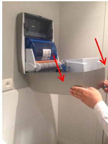
2. Laat de kap zachtjes zakken met beide handen.