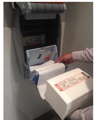
8. Pak de cassette vast met het afdekvel boven (right: rechterhand en left: linkerhand).