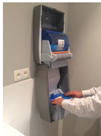
18. Sluit de klep van de cassettehouder