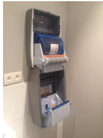
3. Zorg dat de kap niet tegen de muur slaat.