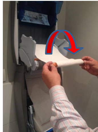
14. Draai deze twee keer rond, naar je toe.