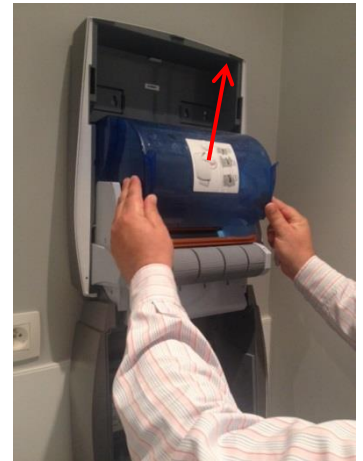
4. Open de bovenste hygiëneklep.