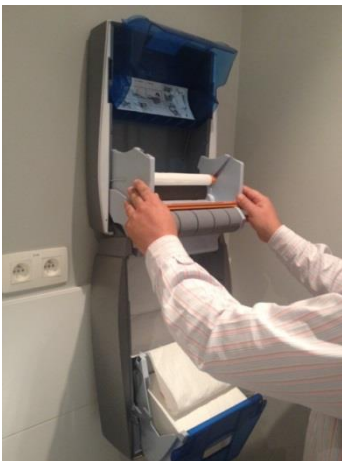
16. Duw de rolhouder naar achter.