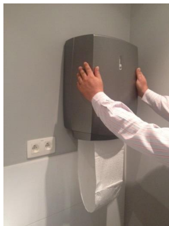
21. Zorg dat de kap goed gesloten is.