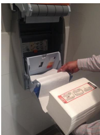
9. Voer het onderste vel van de cassette door de opening onderin de cassettehouder.