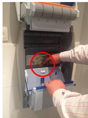
7. Druk op de oranje knop van de cassettehouder. De cassettehouder kantelt automatisch naar voren.