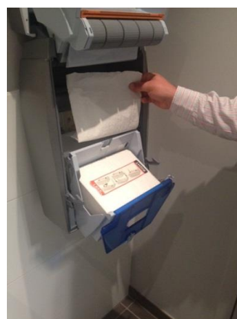
10. Leg de cassette in de cassettehouder. Trek het begin van de cassette naar boven.